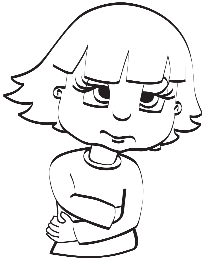
BOLOVI U TRBUHU / MUČNINA